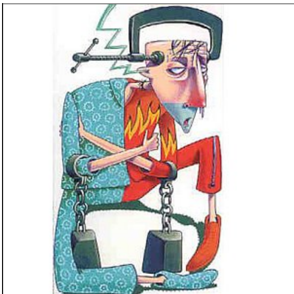
Výskyt akutních respiračních infekcí a chřipky v ČR