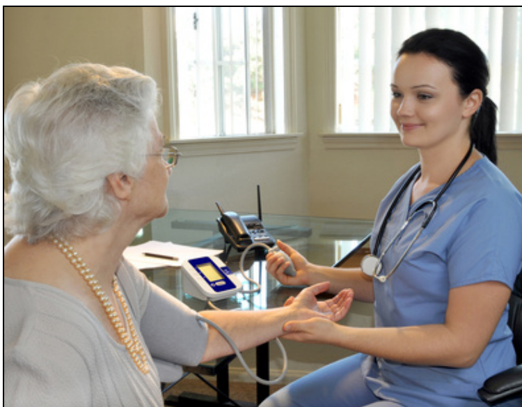
Studie zdravotního stavu populace