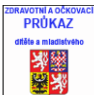
Zdravotní a očkovací průkaz