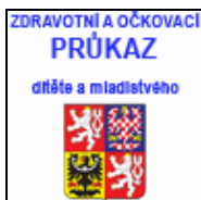
Zdravotní a očkovací průkaz