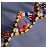
Genetika a genomika