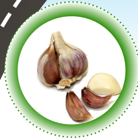
česnek a přírodní dochucovadla