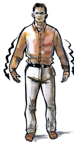
protřepání ramen, paží i zápěstí