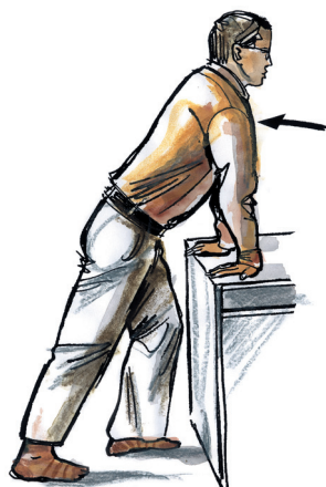
protažení ohybačů ruky prsty směřují dozadu, tah na přední straně HK, výdrž 3-5 sec