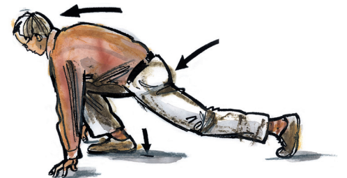
protažení zadní strany DK a zad výdrž 3-5 sec