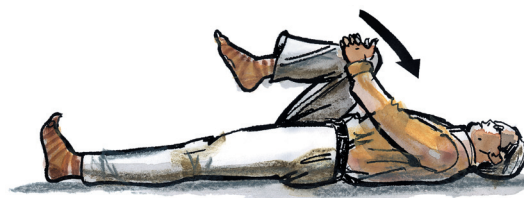
přitažení jednoho či dvou kolen k břichu, výdrž 3-5 sec