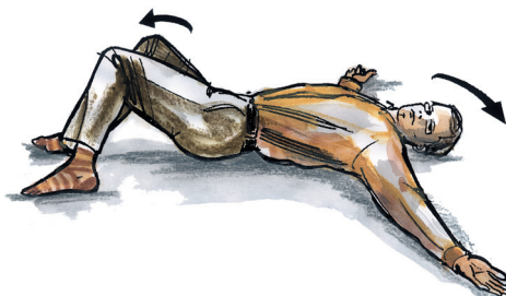
rotační cvik s pokrčenými DK - hlava se vždy otáčí na opačnou stranu než kolena