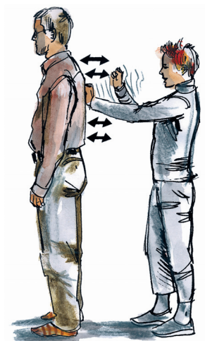
poklepání zad pěstmi (dlaněmi) rukou ve dvojici