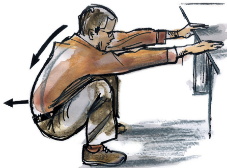
protažení v podřepu