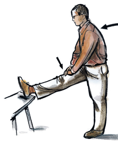
pánev posuň dopředu, noha stále natažená výdrž 3-5 sec