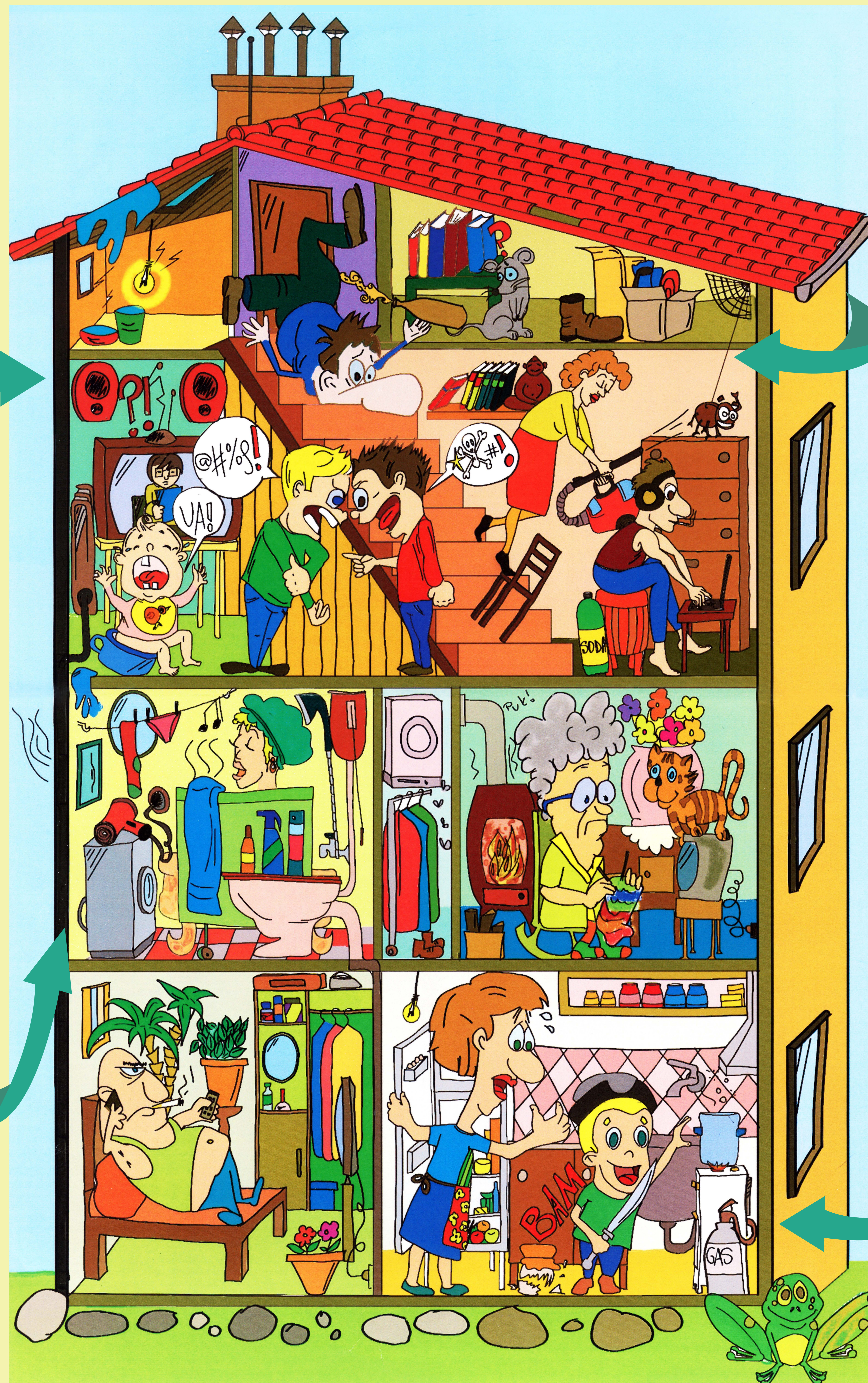
Ilustrace: Raya Mareva

Vyhodnocení testu: 12 - 15 Váš domov je bezpečný 9 - 11 Váš domov je celkem bezpečný 6 - 8 Váš domov není příliš bezpečný 0 - 5 Váš domov je rizikový