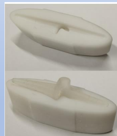
Obrázek č.3: Finální tvar pomůcky