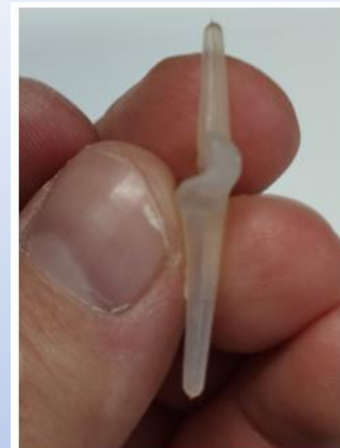
Obrázek č.2: Držení v ruce