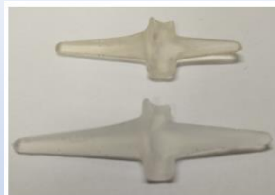
Obrázek č. 1: Silikonové klouby

Pro zefektivnění výroby byl vznesen požadavek z výroby pro vytvoření pomůcky. Požadavek zadání byl, aby laboranti nemuseli držet silikonový kloub přímo v ruce, když zabrušují přetoky silikonových kloubů (Silikonová endoprotéza prstního kloubu). Problém při tomto zabrušování jsou bolesti v rukách, protože tyto součásti jsou malé a ohebné, v horších případech se stalo i to, že bruska při vysokých otáčkách sjela z výrobku a došlo k mírnému poranění ruky (obroušení kůže nebo nehtu). Po navržení požadavku se oddělení TE pustilo na tvorbu pomůcky od prototypu k finální pomůcce. K navržení pomůcky se použil reálný výrobek, podle kterého se vytvořil 3D model v programu SolidWorks a na 3D tiskárně Anycubic Photon Mono M5s se vytvořil prototyp až k finální pomůcce (šířka, výška a tvar přípravku). Aktuálně si laboranti mohou pomůcku s výrobkem upnout do kloubového svěráku a tím snížit až eliminovat riziko poranění ruky.